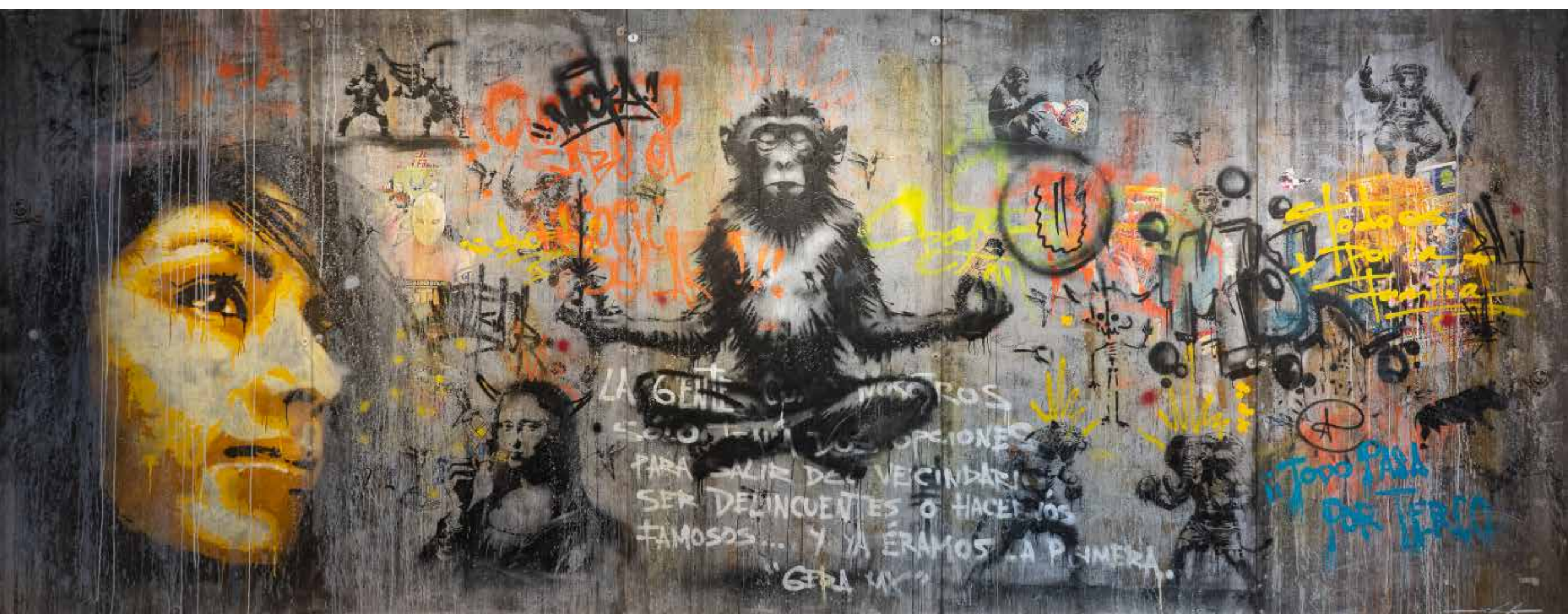
Vestigios del taller Mixta sobre concreto 239 x 608 cm políptico 2025 $654,000 mxn