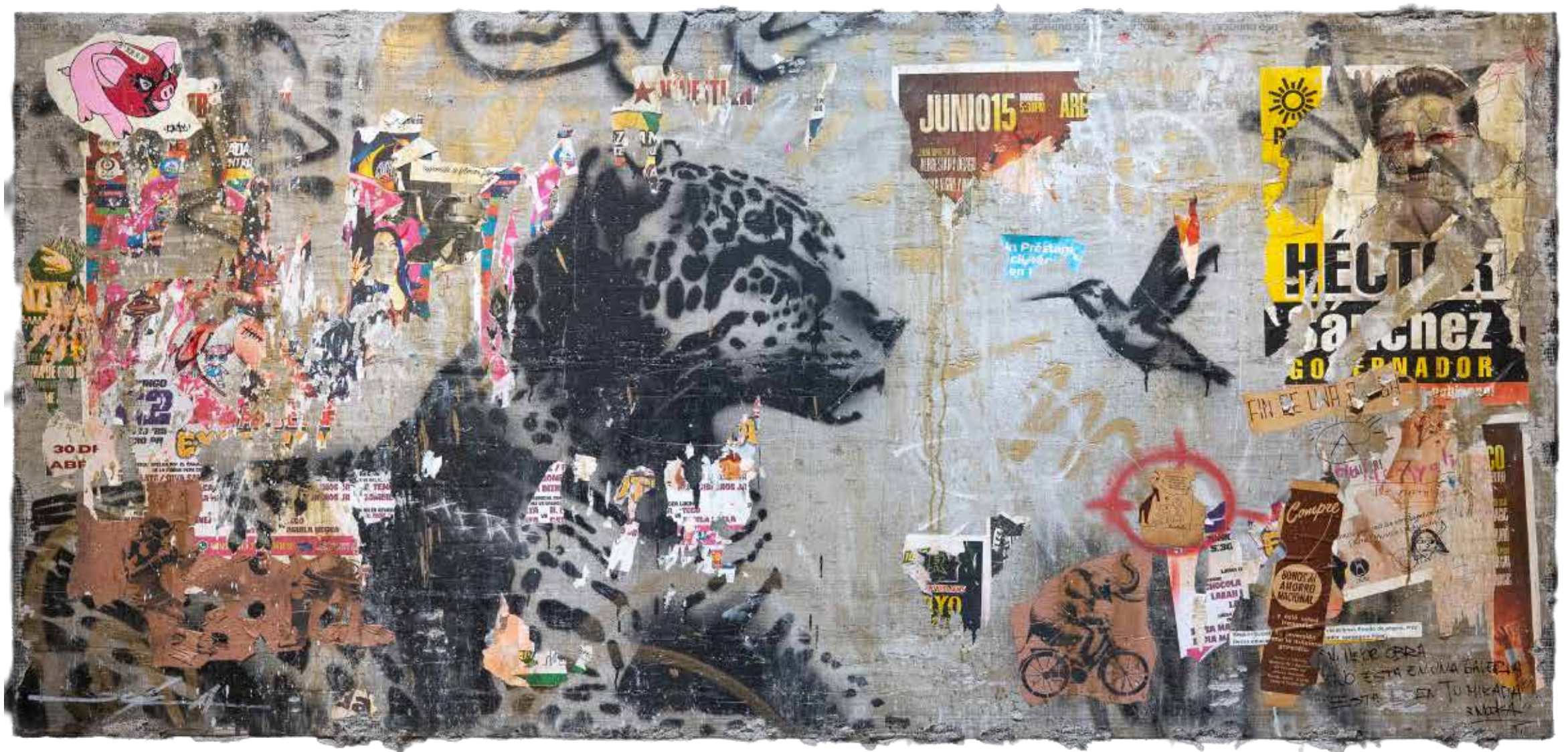
Reposo sagrado Mixta sobre concreto 122 x 224 cm 2025 $134,000 mxn