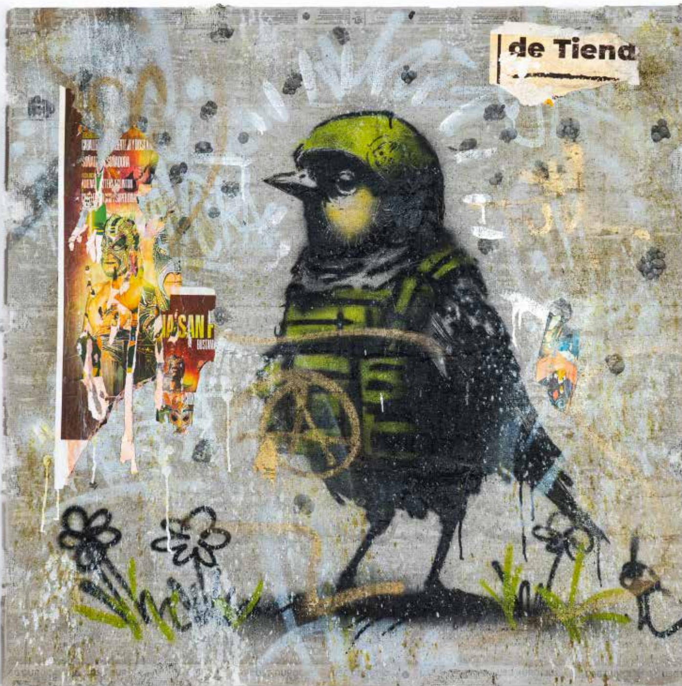
Primavera 2 Mixta sobre concreto 122 x 122 cm 2025 $67,000 mxn