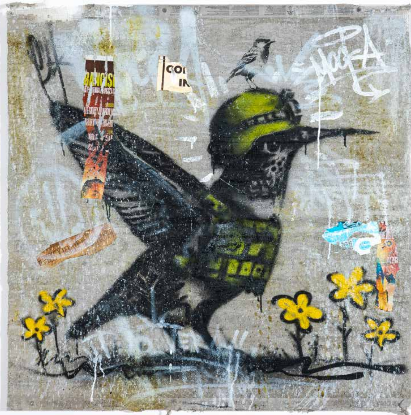
Primavera 1 Mixta sobre concreto 122 x 122 cm 2025 $67,000 mxn