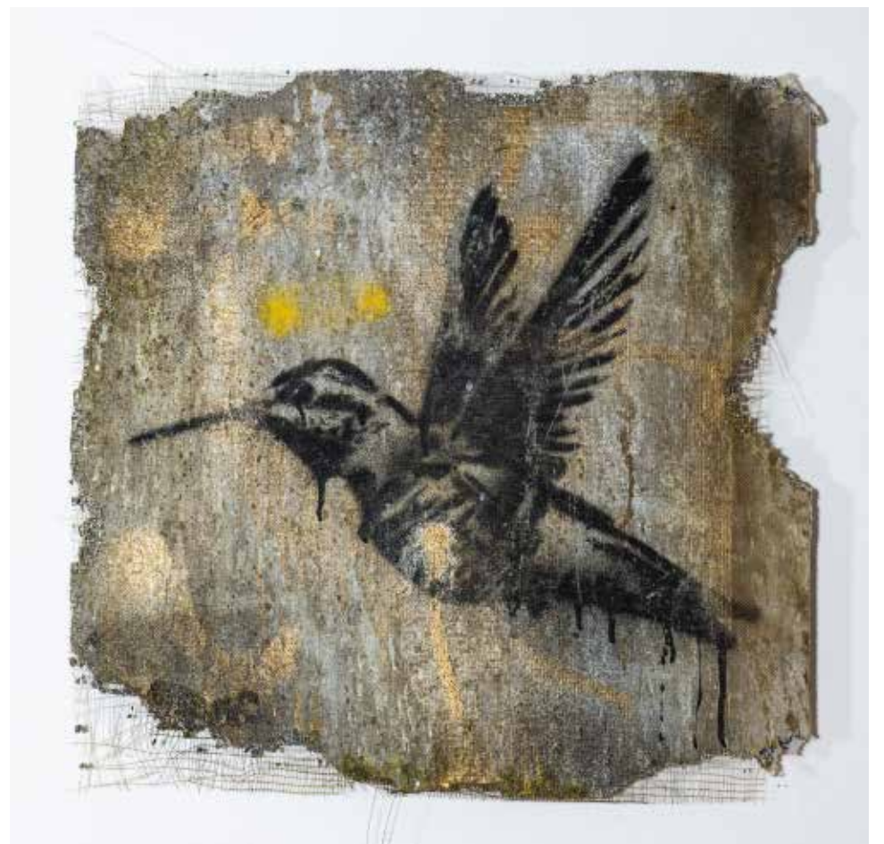
Guardianes del Alma Mixta sobre concreto 61 x 61 cm 2025 $17,000 mxn cada una