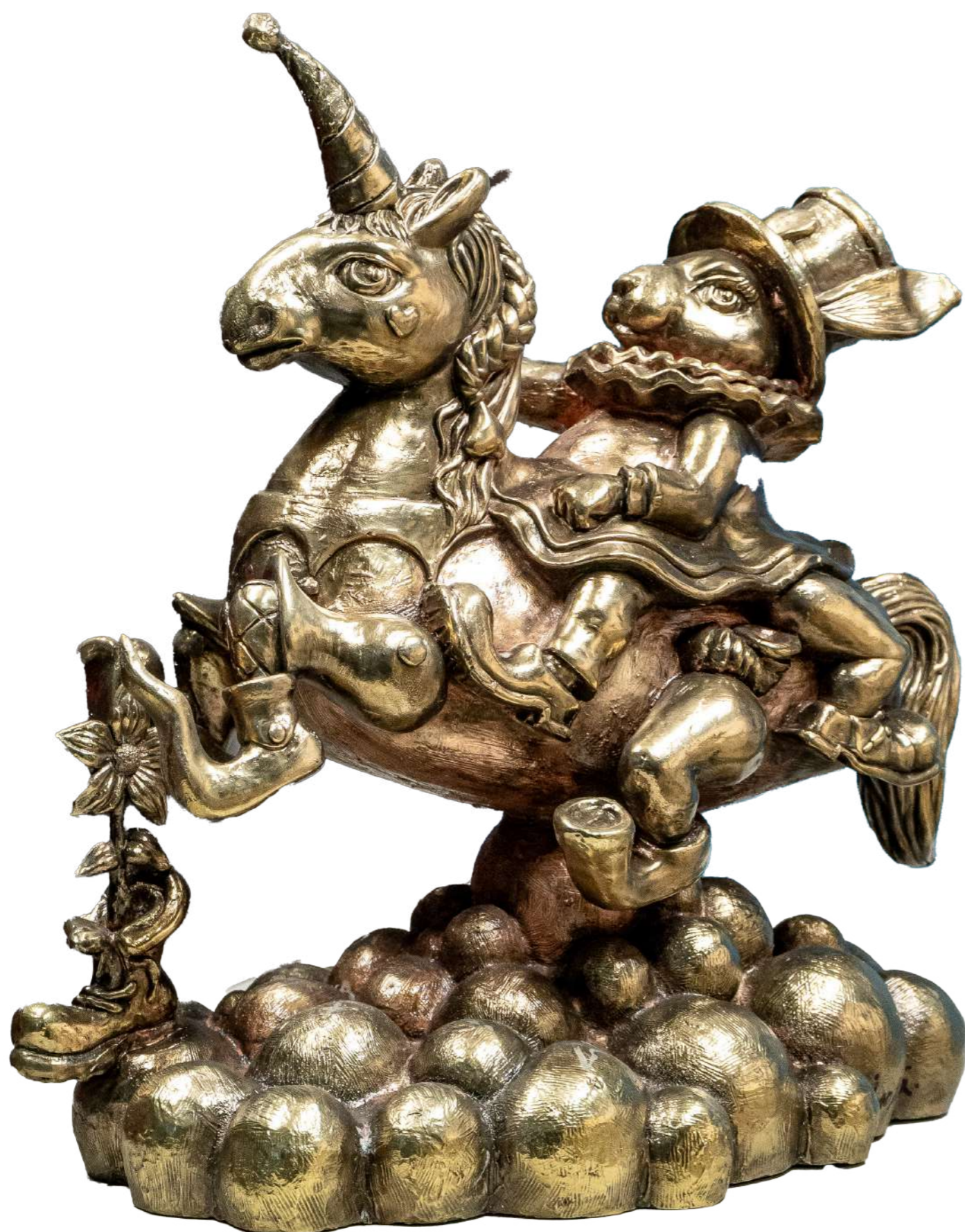
Conejita de paseo