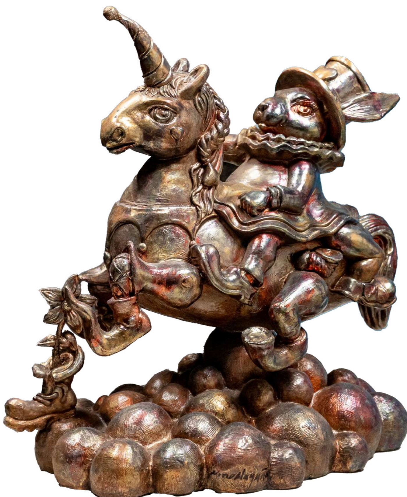
Conejita de paseo