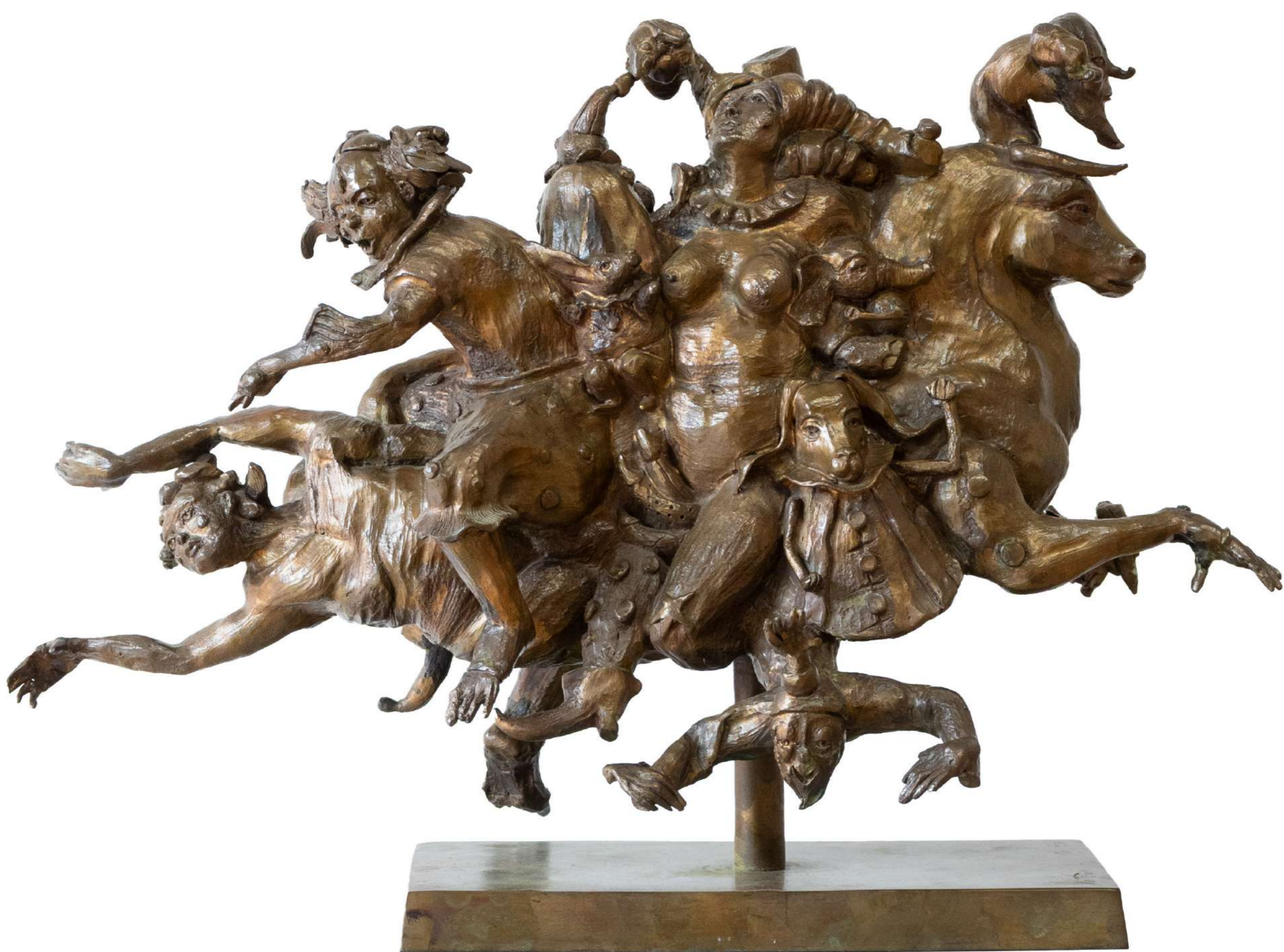
Bronce 38 x 51 x 22 cm 2025 Devolución con artista