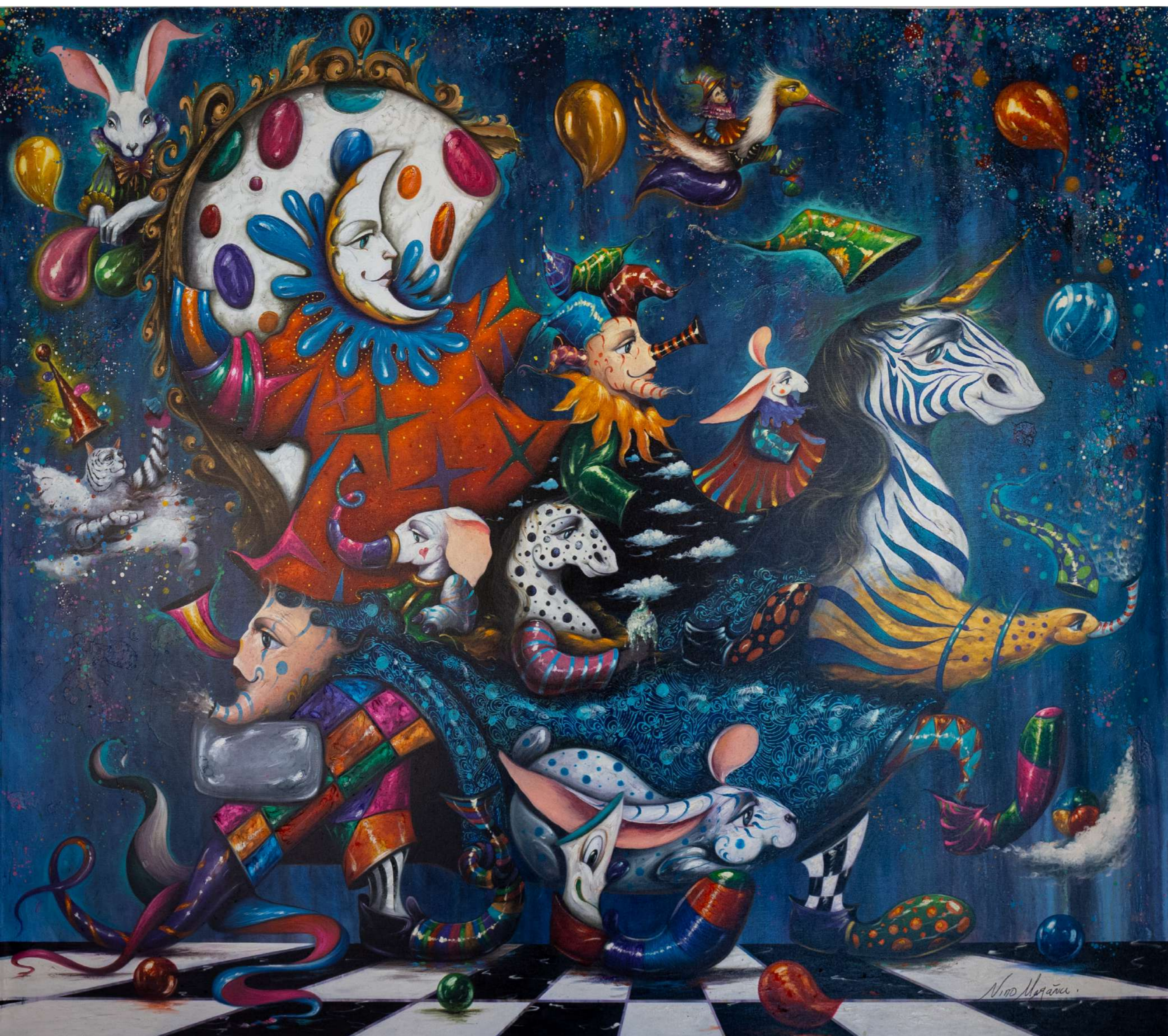
La luna con amigos Mixta sobre tela 227 x 270 cm 2025 Devolución con artista