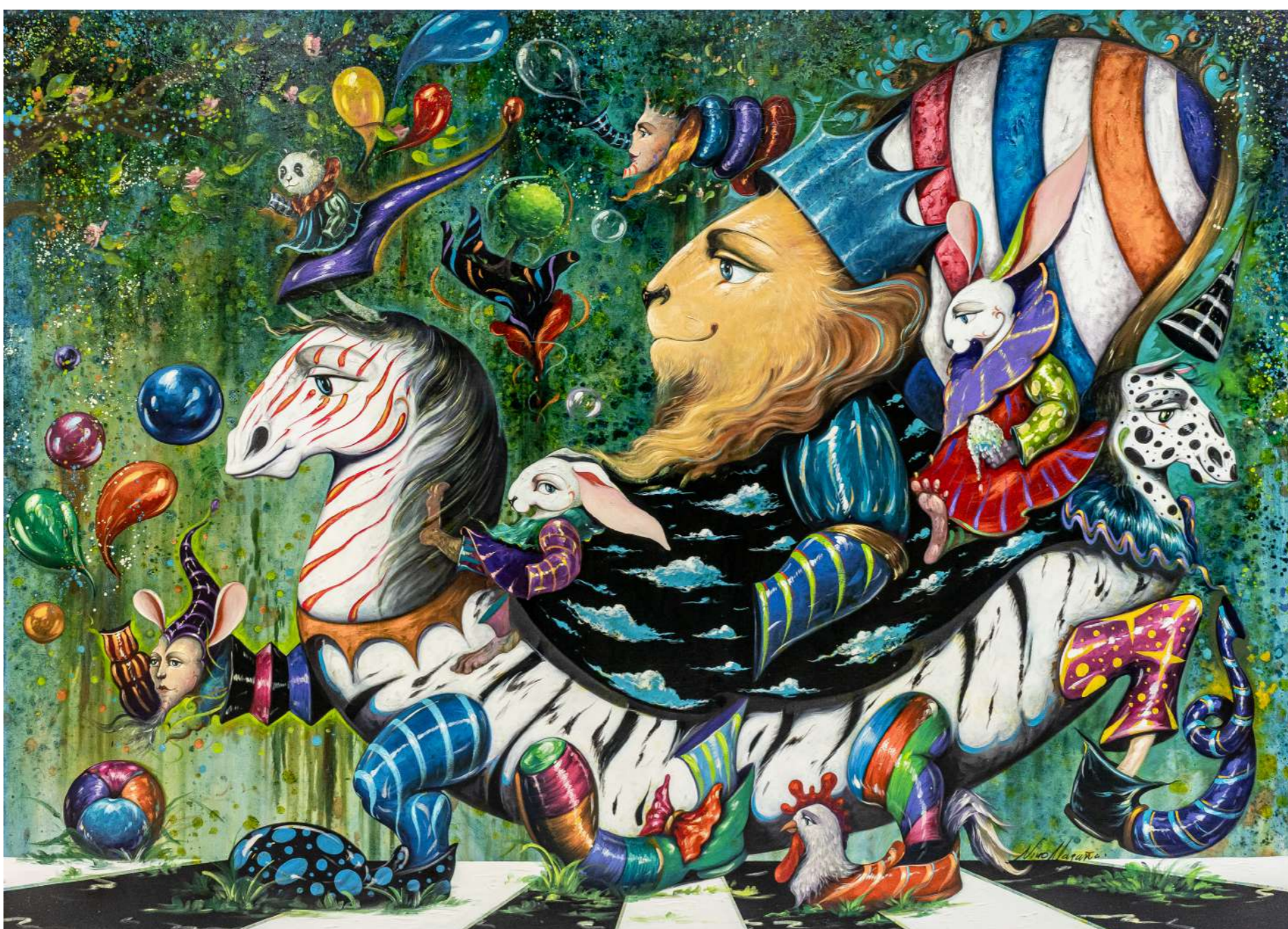
De camino a la fiesta