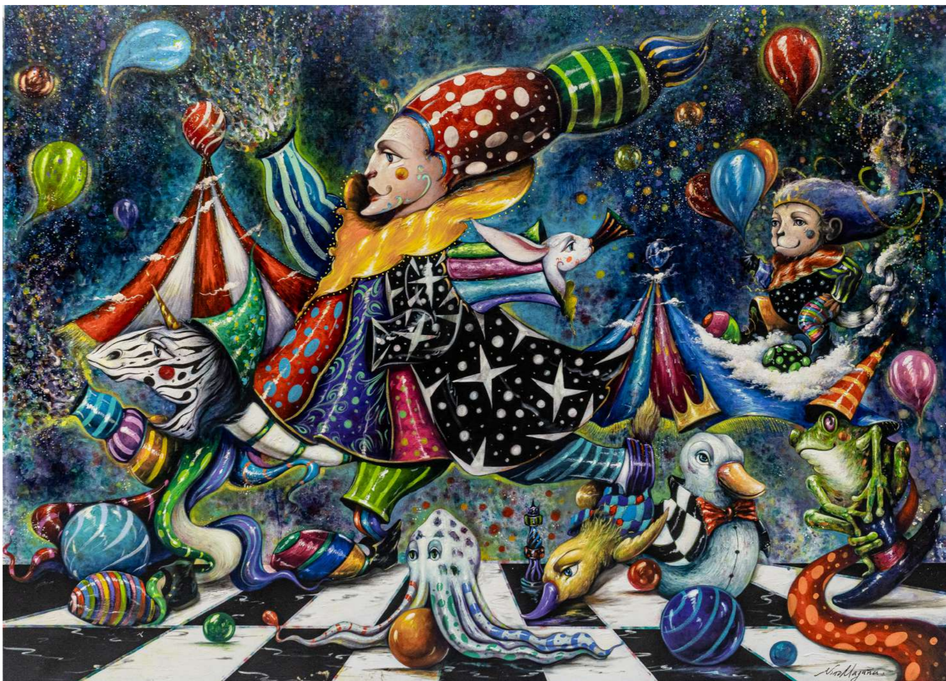
El juego del mago Mixta sobre tela 180 x 250 cm 2025 Vendida