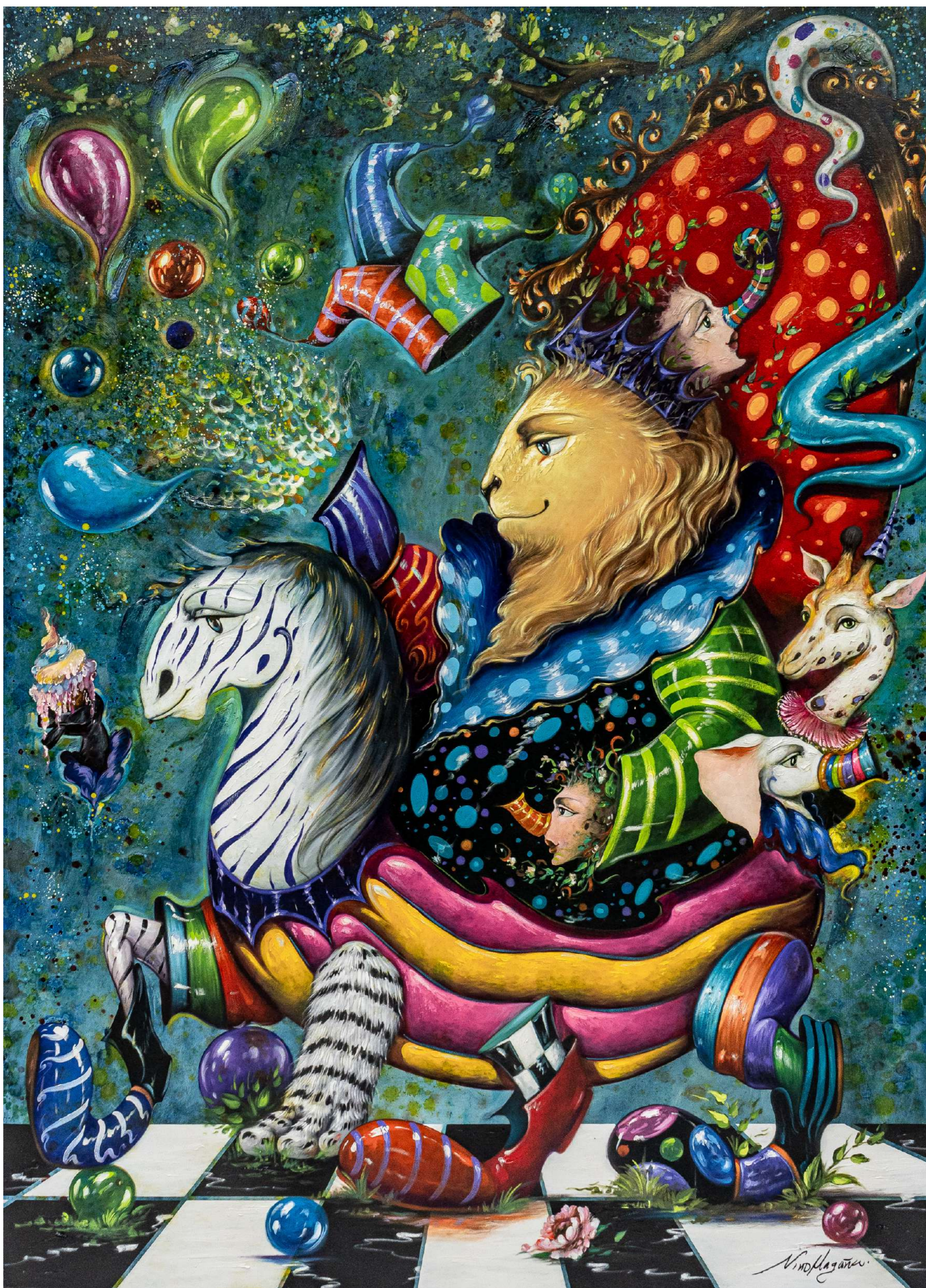
El rey de la selva Mixta sobre tela 200 x 145 cm 2025 Devolución con artista