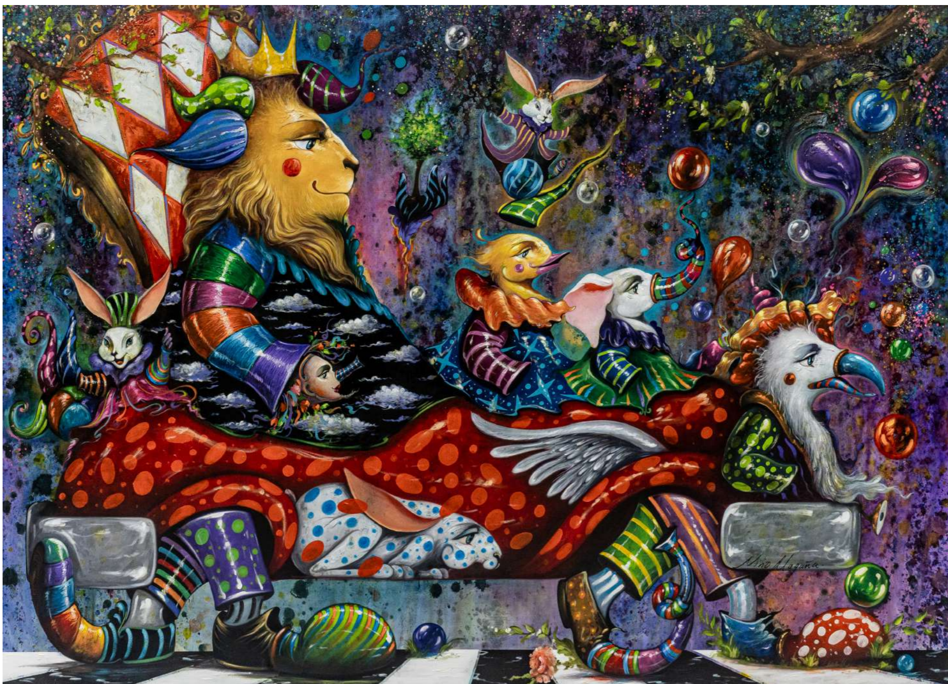
El rey de paseo en cochecito con amigos