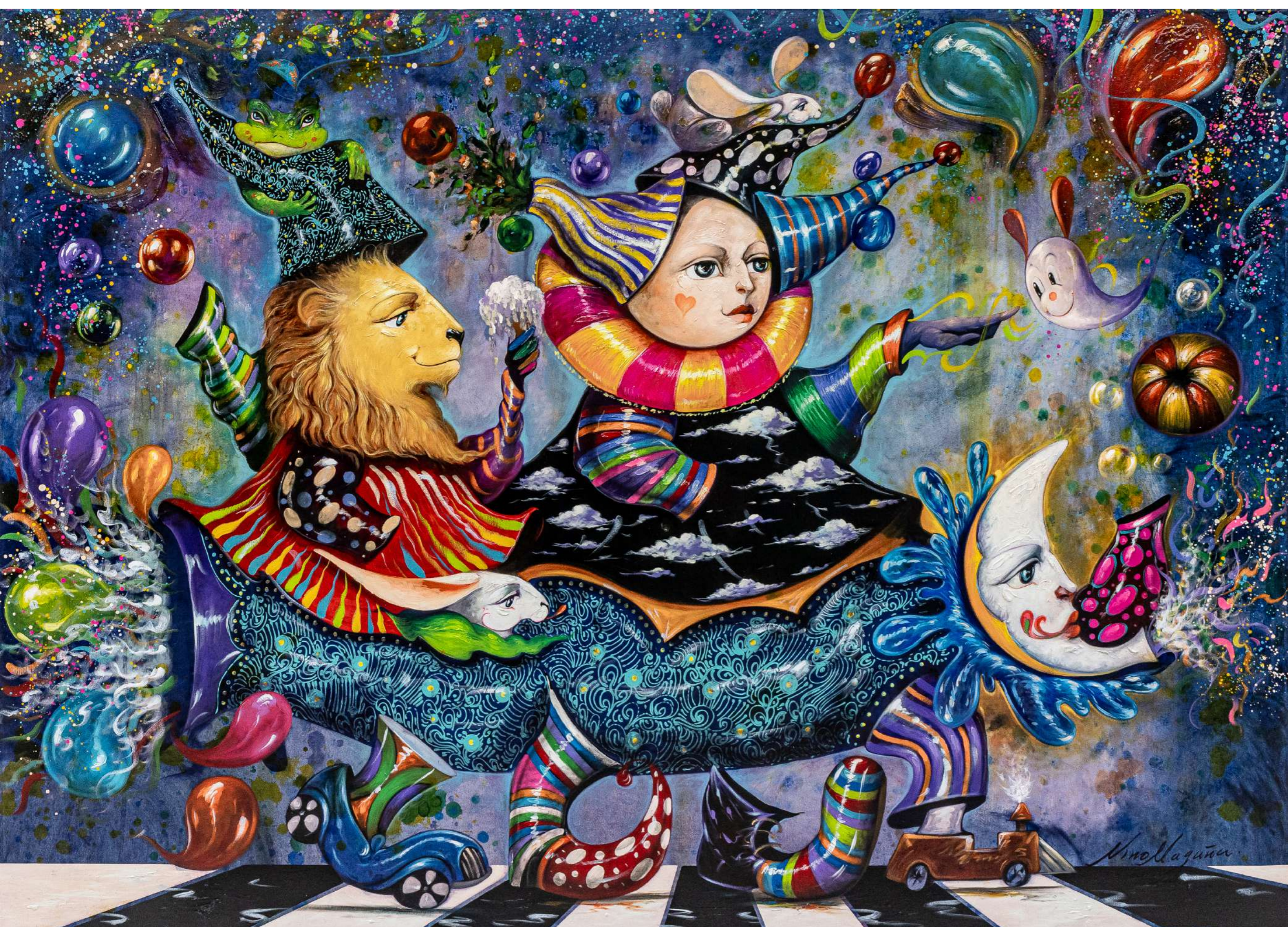
Nocturno Mixta sobre tela 145 x 200 cm 2025 Vendida