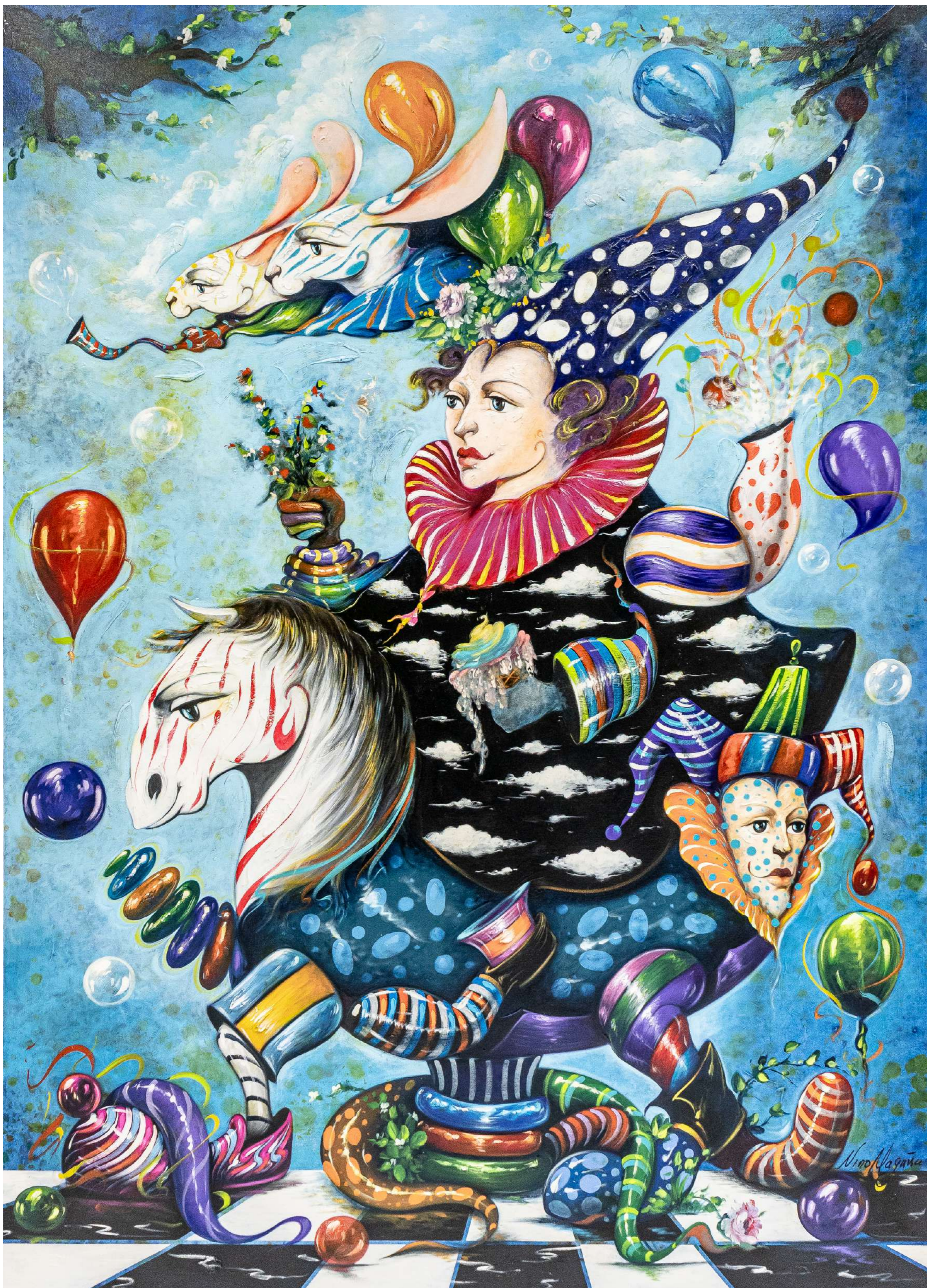
En busca del amor Mixta sobre tela 200 x 145 cm 2025 Devolución con artista