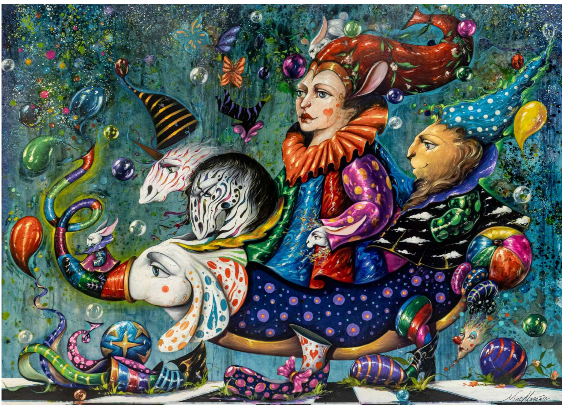
Flora Mixta sobre tela 180 x 250 cm 2025 Devolución con artista